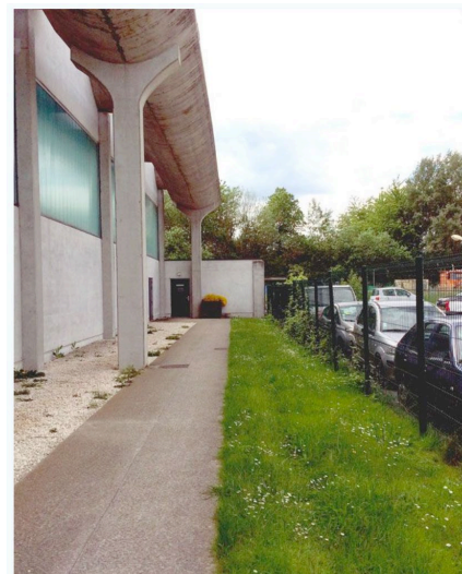
Longez le grillage des services techniques à l'arrière du gymnase Blaise Pascal. La petite porte au fond est celle du stand de tir.